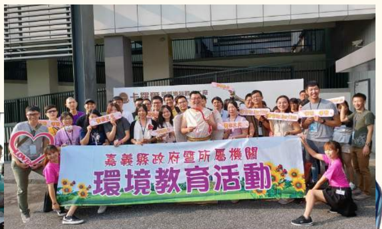
▲參與學員合影留念