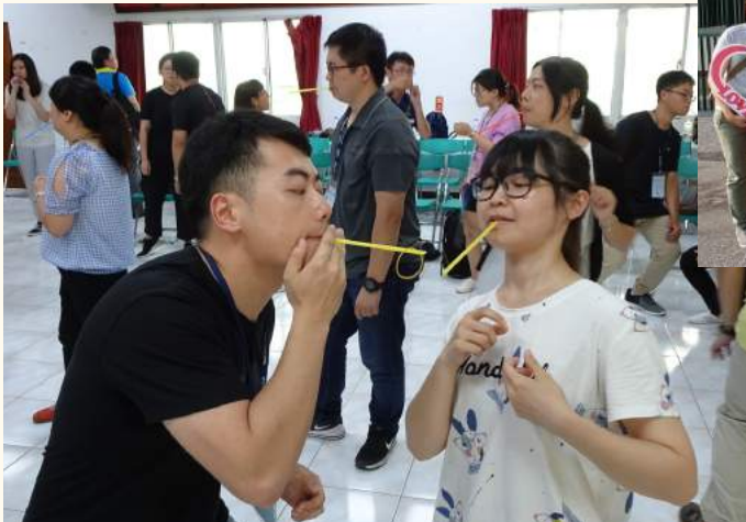
▲學員透過遊戲互動，拉近彼此距離

為擴大本縣各機關學校公教員工生活領域，並增進各機關學校間異性同仁之互動，同時行銷地方特色與產業，於7月17日假本縣大林鎮公所及上林社區等地舉辦本縣未婚公教員工環境教育活動；並邀請大林鎮鎮長簡志偉扮演「愛神邱比特」為配對成功之男女獻上祝福；本場次計40人參加，共7對男女配對成功。