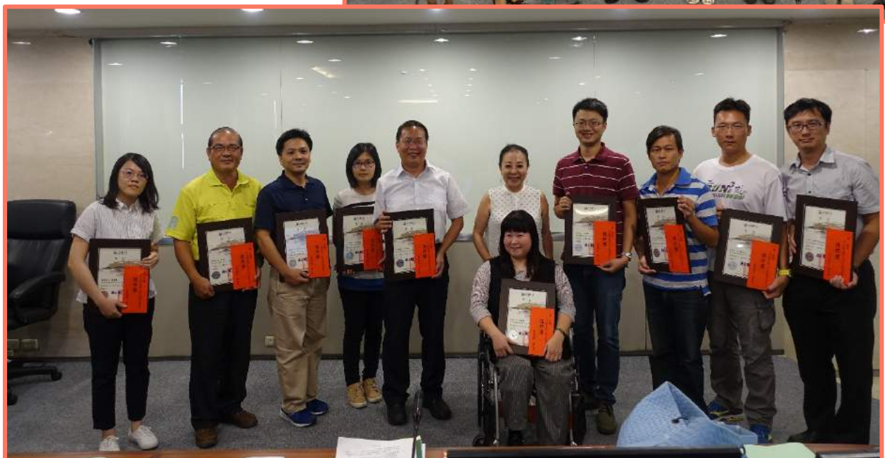
▲縣長與106年度「創新嘉園-加減乘除創意點子王」得獎者合照留影