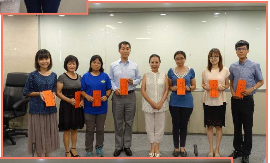
縣長與106年度「公務人員專書閱讀心得寫作競賽」佳作得獎者合照留影