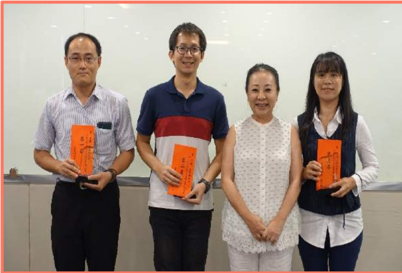
◀縣長與106年度「公務人員專書閱讀心得寫作競賽」前三名得獎者合照留影

【本報訊】 為激勵公務人員品德修養與工作潛能，累積本府智慧資本，期使同仁皆具備積極任事及創新思維，進而有效提升團隊競爭並打造優秀的施政團隊，以因應縣政的推動發展願景，於9月19日主管會報由縣長張花冠頒發本縣本年度「公務人員專書閱讀心得寫作競賽」及「創新嘉園-加減乘除創意點子王」獎項。