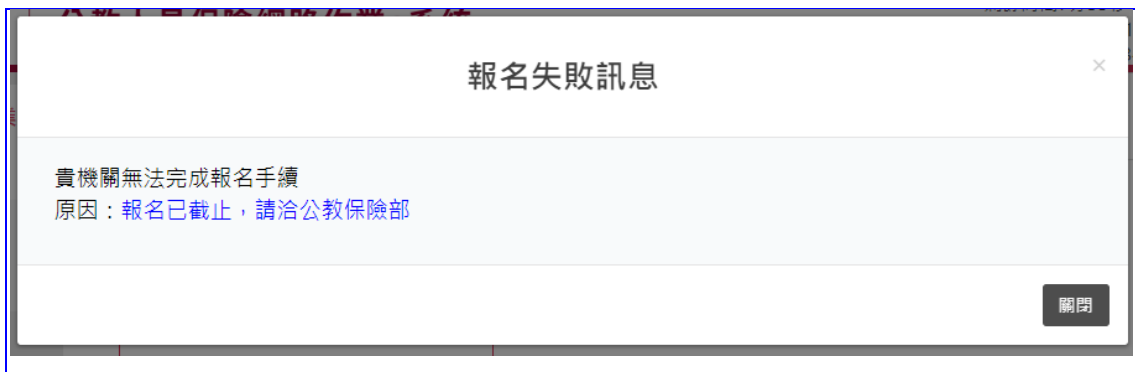
【圖 6】業務座談會報名詳細資料-報名失敗訊息(範例)