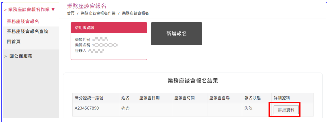
【圖 5】業務座談會報名結果畫面-報名失敗