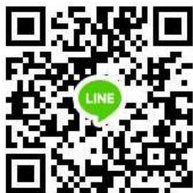
教科書業務 LINE 群組

群組(如附圖QRCode)以利接收最新消息，如有其他問題亦可於群組提問，如有更換承辦老師，請務必將系統帳密交接，並邀請加入群組。