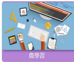
工作教導 友善職場