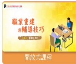
工作教導 職業重建與輔導技巧