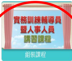
實務訓練輔導員暨人事人員講習課程