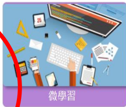
工作教導 其他人事作業