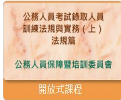
人事行政 公務人員考試錄取人員訓練法規與實務(上-法規篇)