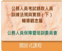
人事行政 公務人員考試錄取人員訓練法規與實務(下-輔導觀念篇)