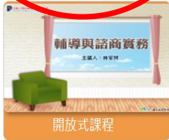
人事行政 輔導與諮商實務