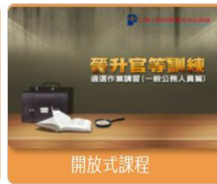
人事行政 晉升官等訓練選作業講習(一般公務人員篇)