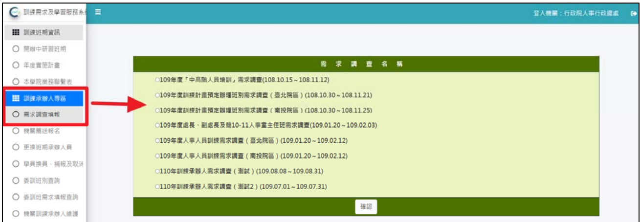
圖 4：進入主畫面後，點選左方「訓練承辦人專區」／「需求調查填報」／「0000 需求調查」／「確定」。