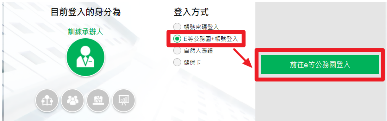
圖 3：登入方式選擇 E 等公務園+帳號登入/自然人憑證/健保卡

如果選擇 E 等公務園+帳號登入、自然人憑證、健保卡登入的話，系統會提供連結，點選即連結至 E 等公務園+登入頁，請選擇其中一種登入方式並完成登入，系統即會自動導回訓練需求及學習服務系統。