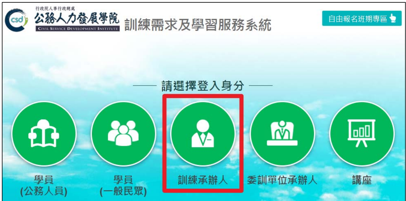
圖 1：點選「訓練承辦人」，進入登入頁。

請先進入訓練需求及學習服務系統首頁 https://service.hrd.gov.tw/