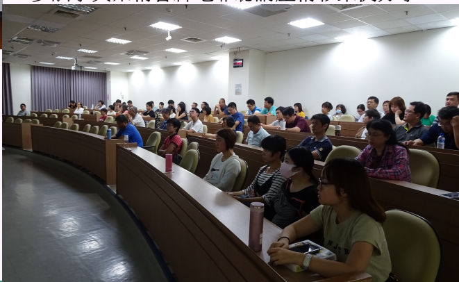
▼參訓學員聚精會神地聆聽講座精彩案例分享