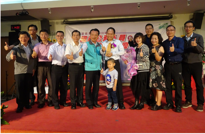
▲縣長翁章梁與模範公務人員及親友團合影留念

為增進本府各級長官及同仁相互交流、凝聚縣政共識，並藉以表揚本年度模範公務人員、績優公務人員及服務績優人員，於11月19日辦理「模範公務人員暨服務績優人員頒獎典禮暨感恩茶會」，會中邀請本縣縣長翁章梁蒞臨頒獎及致詞，計150人參加。