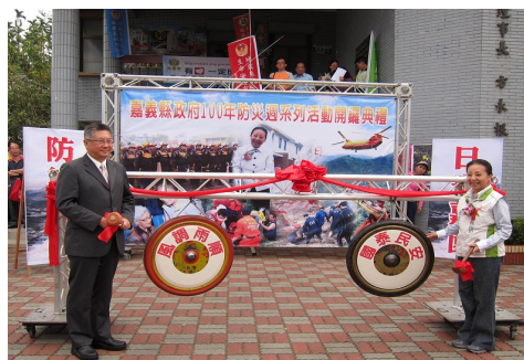
本府防災週系列活動開鑼

本縣消防局係本縣防災與救災最主力機關，查本縣消防局的組設沿革，本縣消防機關過去隸屬於警察機關，當時各縣市警察局，雖有消防隊之名，卻都由警察局保安課長兼任隊長，隊務由承辦消防業務之課員兼任。整個消防業務只單純擔任消極性之災害搶救工作，