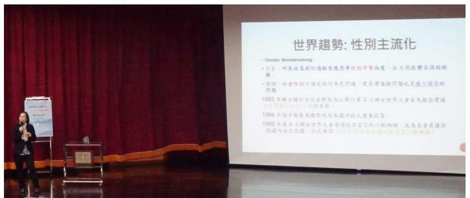
▲ 鼓勵打破萬年窠臼的性別迷思，不只是男性對性別意識有著迷思，女性亦然。