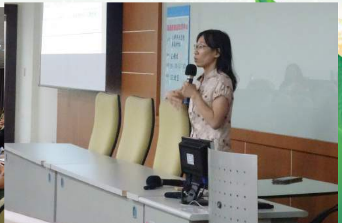
▲講座透過同婚、新移民等多元性別及多元家庭故事分享，培養同仁差異敏銳度，並提升多元文化素養，以開放、接納的態度欣賞差異性。