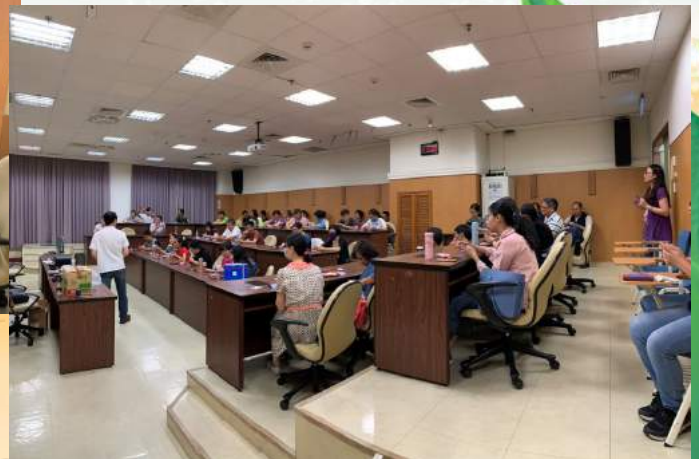
▲穆艾卿老師帶領學員魔術教學之實作