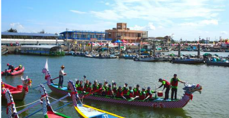
◀本府主管代表隊整隊出發

為歡慶端午佳節，108年端午龍舟競賽於6月7日上午假本縣東石鄉漁人碼頭舉辦；本項賽事由本府主管代表隊與本縣議會代表隊表演賽揭開序幕，本府主管代表隊選手全力以赴，展現絕佳之團隊精神。