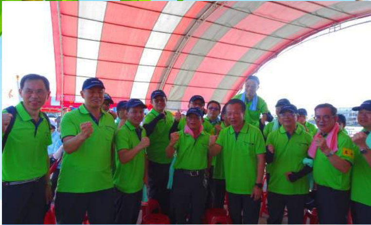
◀翁縣長於賽前帶隊呼喊口號

為歡慶端午佳節，108年端午龍舟競賽於6月7日上午假本縣東石鄉漁人碼頭舉辦；本項賽事由本府主管代表隊與本縣議會代表隊表演賽揭開序幕，本府主管代表隊選手全力以赴，展現絕佳之團隊精神。