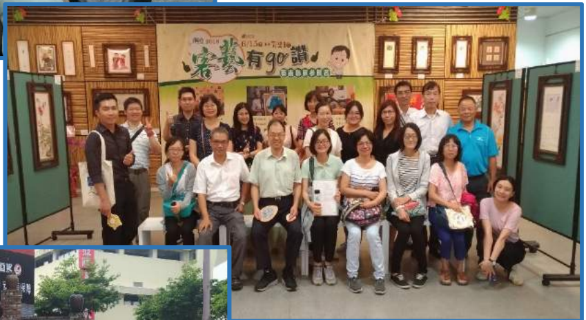
◀南平區聯繫會報—會後合影留念。