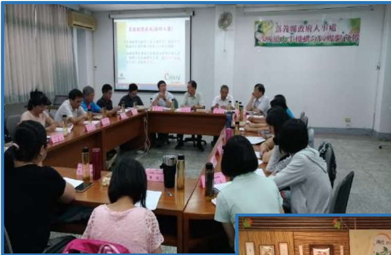
◀北平區聯繫會報—提案交流討論。

【本報訊】為匯集現有資源，強化各分區人事機構間合作夥伴關係，提升區域整合及水平溝通協調，於6月26日委本縣溪口鄉公所辦理北平區聯繫會報，計25人參加，7月4日委本縣消防局辦理南平原區聯繫會報，計30人參加，嗣於7月20日委本縣大埔鄉公所辦理山區聯繫會報，計22人參加，共計3場次；與會人員相互業務交流、研討個案，並於會後辦理環境教育及企業參訪等行程，鼓舞工作情緒，促進情感交流。