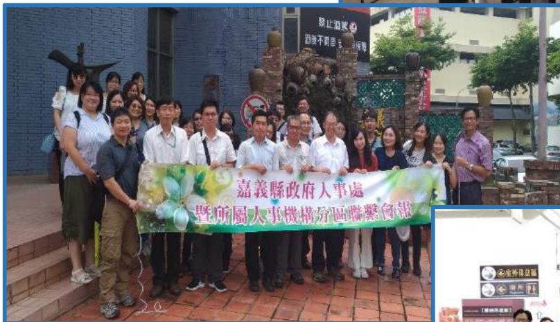
企業參訪—參訪嘉義酒廠產品推廣中心。▶