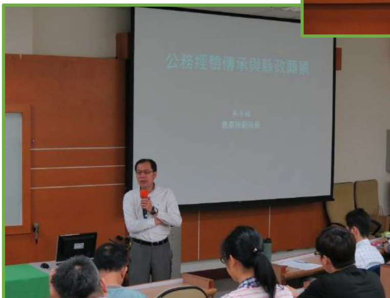
◀吳副縣長講授「公務經驗傳承與縣政願景」，期學員對縣政概況具初步認知。