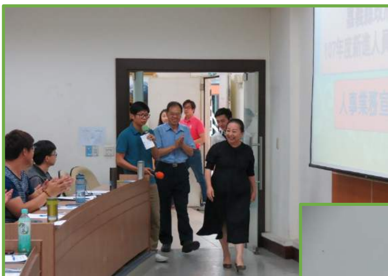
◀張縣長特蒞臨會場，同仁予以熱烈歡迎。

【本報訊】 為增進新進人員對本縣施政主軸之認識，協助渠等迅速適應職場環境，對其相關權益義務與待遇福利事項具概括之認識，於4月19日辦理「嘉義縣政府107年度新進人員座談會」，張縣長特蒞臨會場致詞勉勵，並邀請吳副縣長講授公務經驗傳承及縣政願景，期培訓優質在地化公務人力，計87人參加。