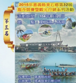
第三名 義竹國民中學 主任 翁慧娥 名稱：2015年嘉義縣東石鄉第32屆龍舟競賽暨觀光行銷系列活動