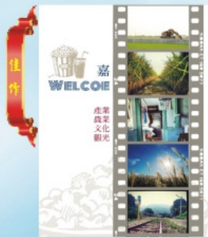
佳作 竹崎鄉公所 課員 陳柏鈞 名稱：嘉Welcome