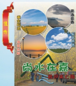
佳作 南新國民小學 教師 江文政 名稱：尚水在嘉