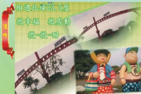
佳作 民雄國民中學 課員 陳文琪 名稱：在「嘉」幸福囉!