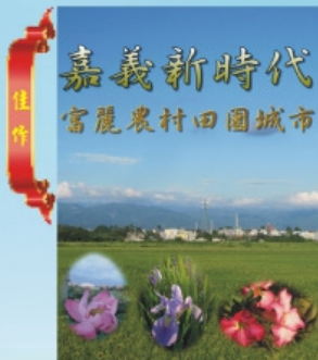
佳作 環境保護局 主任 黃芳菲 名稱：富麗農村田園城市