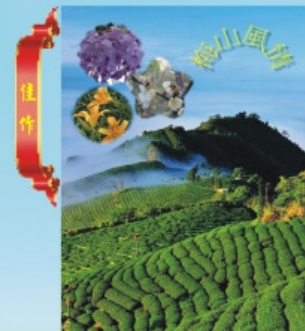
佳作 梅山國民中學 主任 林櫻如 名稱：梅山風情