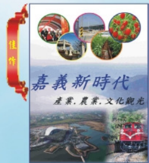
佳作 水上國民小學 主任 羅惠玲 名稱：嘉義新時代