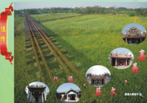
佳作 文化觀光局 主任 郭鎮山 名稱：嘉義·文藝·旅行