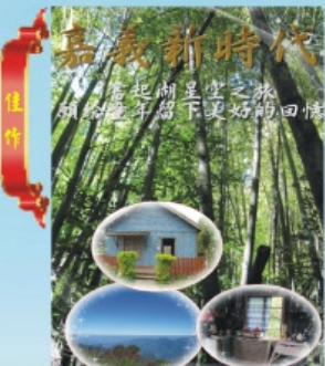
佳作 民雄國民小學 主任 唐淑妙 名稱：嘉義新時代-奮起湖星空之旅